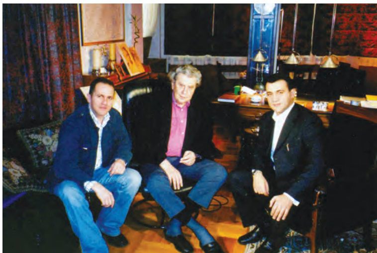
ΡΙΚ 30/1/2004, Συνέντευξη Μίκη Θεοδωράκη