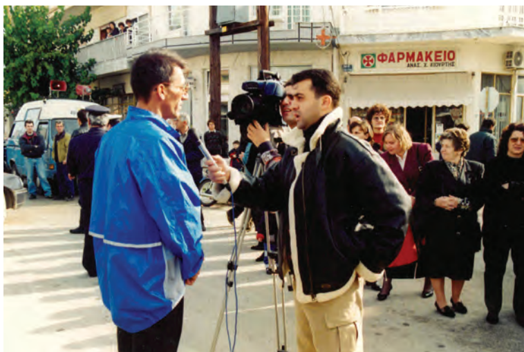
Αλεξανδρούπολη, ΡΙΚ, «ΥΠΕΡ ΔΙΚΑΙΩΝ ΠΟΡΕΙΑ», 1997, Νοέμβρης