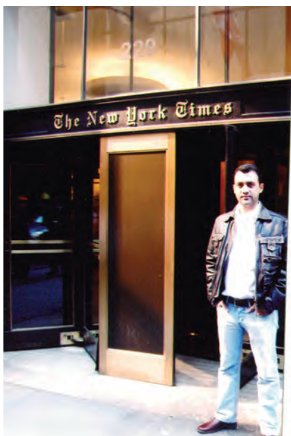
2004, Αποστολή στη Νέα Υόρκη, γραφεία The New York Times