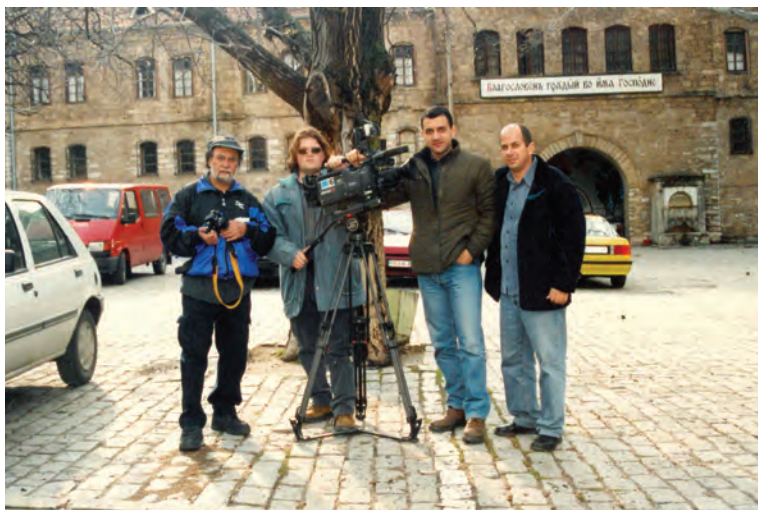
30/3/2002, Συνεργείο ΡΙΚ, Βουλγαρία