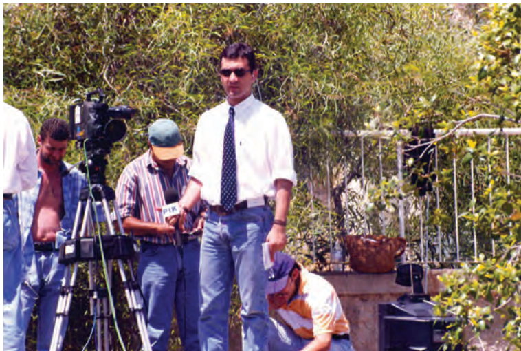
PIK 25/6/98, Αφιξη Στεφανόπουλου, Ζωντανή Μετάδοση