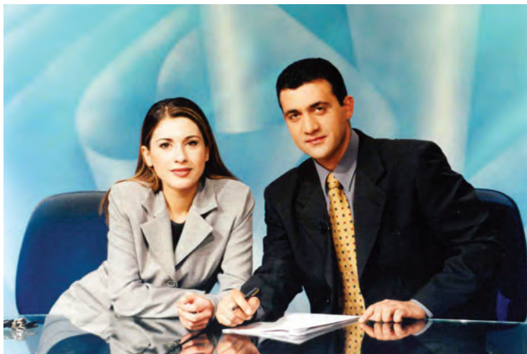
PIK 2000, «Από Μέρα σε Μέρα»