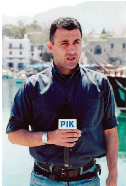
PIK 2003, Κερύνεια κατεχόμενα, Λιμανάκι