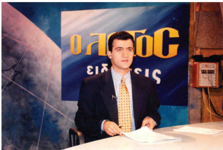
«ΛΟΓΟΣ TV», 1997, Κεντρικό Δελτίο