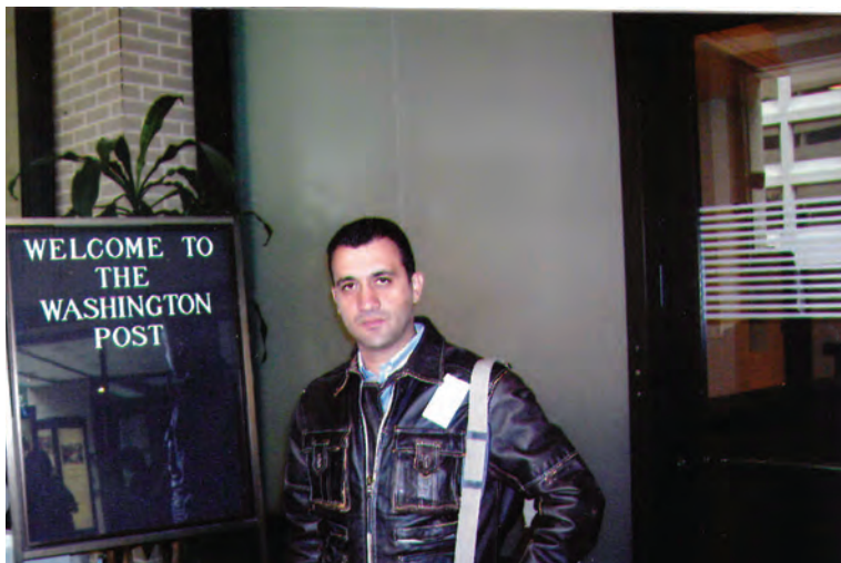
2004, Ουάσινγκτον, γραφεία The Washington Post