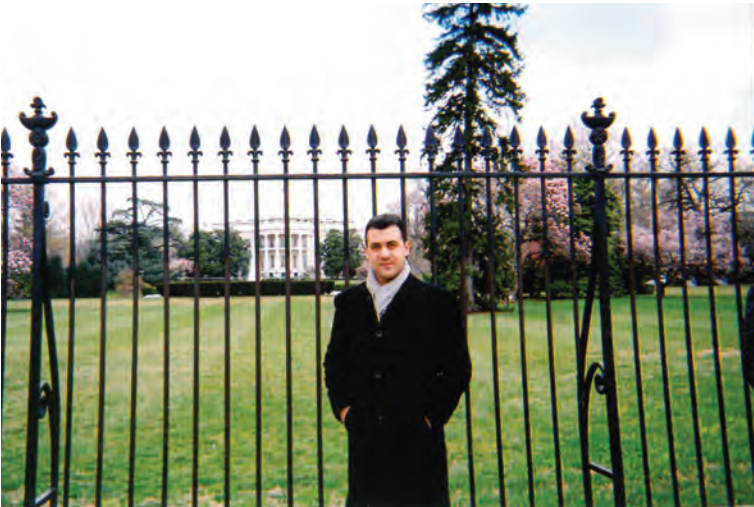
2004, Λευκός Οίκος