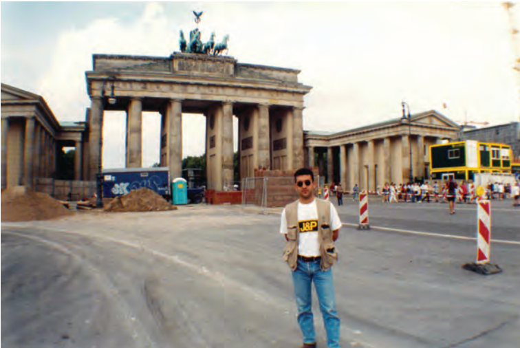
Πύλη του Βρανδεμβούργου, Βερολίνο 1996, «Πορεία Μοτοσικλετιστών»