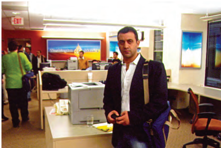
2006, Γραφεία του Al Jazeera