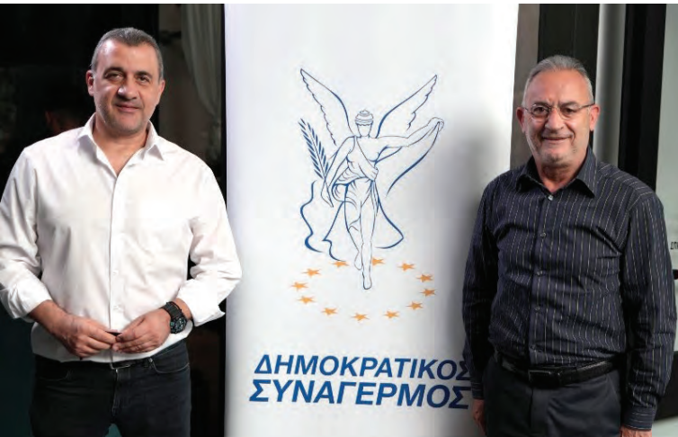
Με τον τέως Πρόεδρο του Δημοκρατικού Συναγερμού Αβέρωφ Νεοφύτου