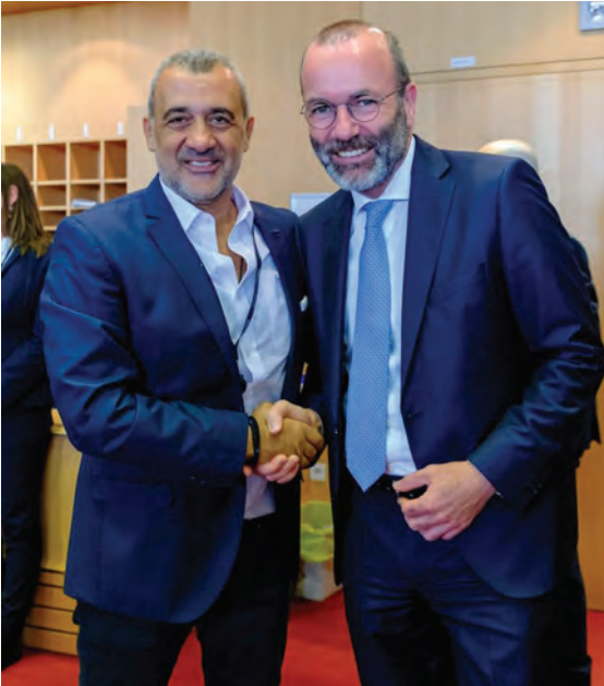
Με τον Πρόεδρο της Κοινοβουλευτικής Ομάδας του Ευρωπαϊκού Λαϊκού Κόμματος Manfred Weber