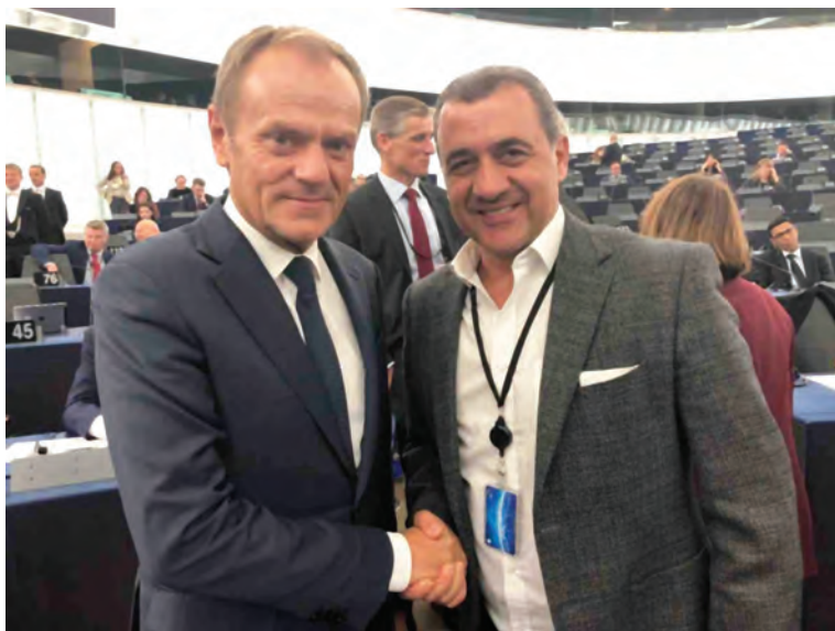
Με τον τέως Πρόεδρο του Ευρωπαϊκού Συμβουλίου Donald Tusk ο οποίος είχε ολοκληρώσει τη θητεία του με απόλυτη επιτυχία