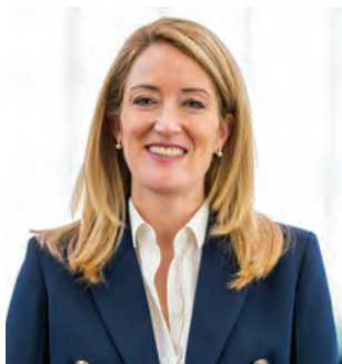
ROBERTA METSOLA Πρόεδρος Ευρωπαϊκού Κοινοβουλίου

Ήταν μεγάλη χαρά για μένα να συνεργαστώ στενά με τον Ευρωβουλευτή Λουκά Φουρλά καθ' όλη τη διάρκεια αυτής της κοινοβουλευτικής περιόδου και να παρακολουθώ την καθημερινή συνεισφορά του στην ευρωπαϊκή δημοκρατία.