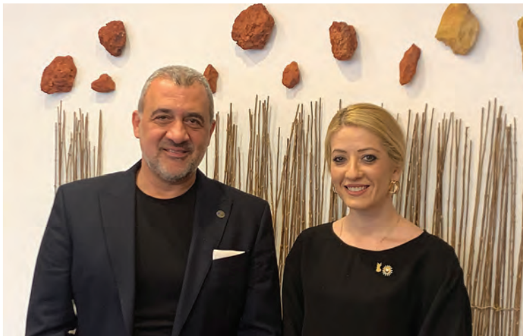
Με την Πρόεδρο του ΔΗΣΥ και Πρόεδρου της Βουλής των Αντιπροσώπων Αννίτα Δημητρίου