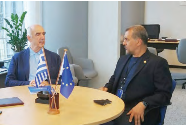
Με τον Αντιπρόεδρο της Ομάδας του Ευρωπαϊκού Λαϊκού Κόμματος Ευάγγελο Μείμαρρακη