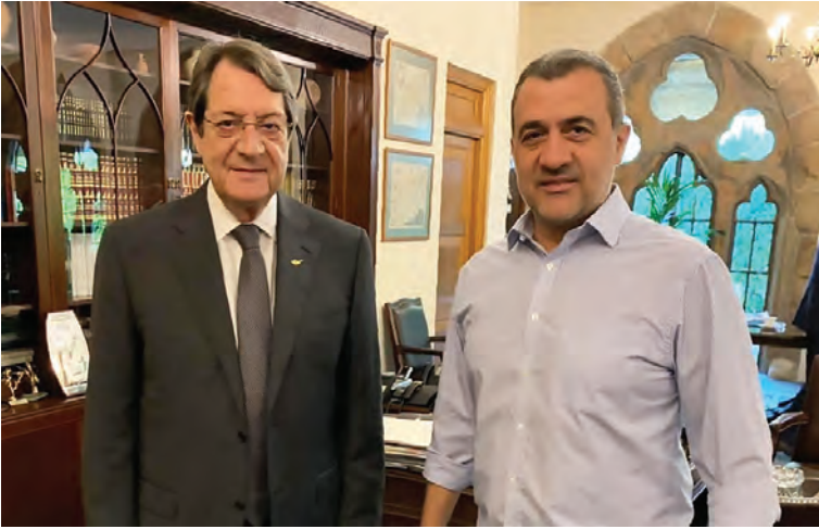
Με τον τέως Πρόεδρο της Κυπριακής Δημοκρατίας Νίκο Αναστασιάδη