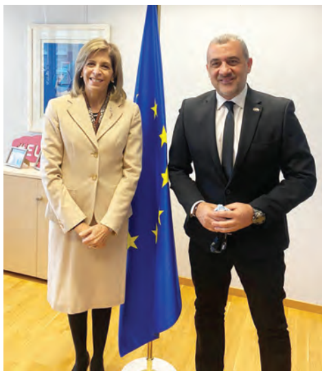
Με την Επίτροπο Υγείας και Ασφάλειας Τροφίμων της ΕΕ Στέλλα Κυριακίδου