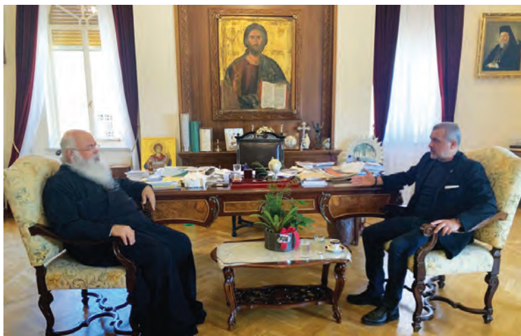
Ουσιαστικές και εποικοδομητικές οι συζητήσεις με τον Αρχιεπίσκοπο Κύπρου κ.κ. Γεώργιο