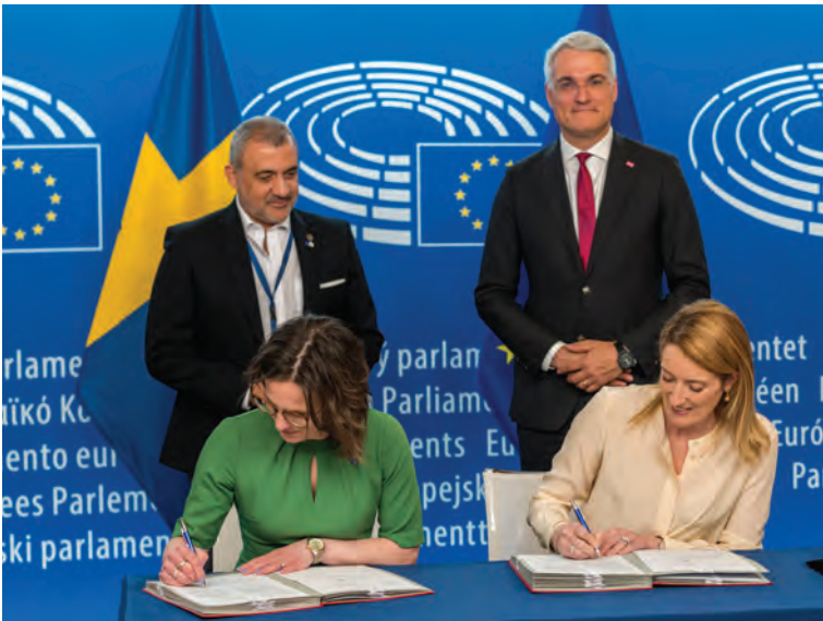
Υπογραφή έκθεσης για το Ευρωπαϊκό έτος δεξιοτήτων

Μία από τις μεγαλύτερες προκλήσεις κατά τη διάρκεια του κοινοβουλευτικού μου έργου ήταν η ανάθεση του Ευρω-