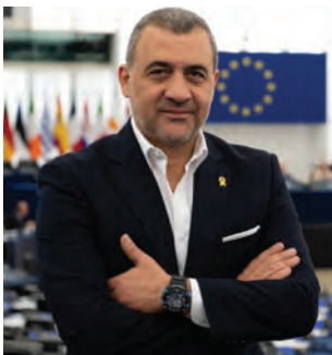
ΛΟΥΚΑΣ ΦΟΥΡΛΑΣ Ευρωβουλευτής

Η συμπερίληψή μου στο ευρωψηφοδέλτιο του Δημοκρατικού Συναγερμού το 2019 ως Αριστίνδην υποψήφιος και η εκλογή μου ως Ευρωβουλευτής αποτελούσαν και αποτελούν για μένα μεγάλη τιμή και συνάμα μεγάλη ευθύνη.